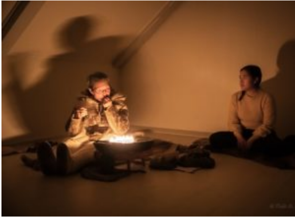
Theatre play “Arnarulunnguaq”