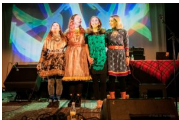
Concert of "Images of the North"