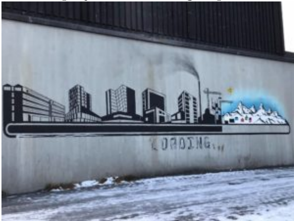
Mural by Inuk Hojgård