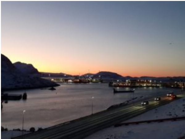
Sunrise in Nuuk