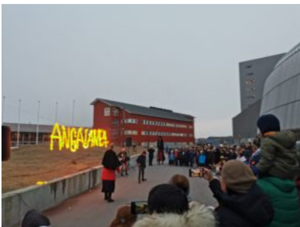
Opening of Nuuk Nordic Festival