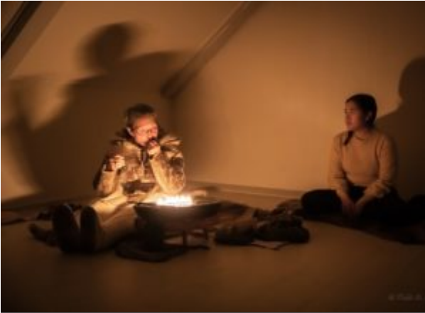
Theatre play "Arnarulunnguaq"