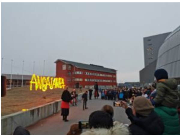
Opening of Nuuk Nordic Festival