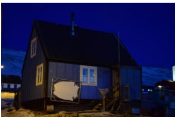
House with a drying sealskin