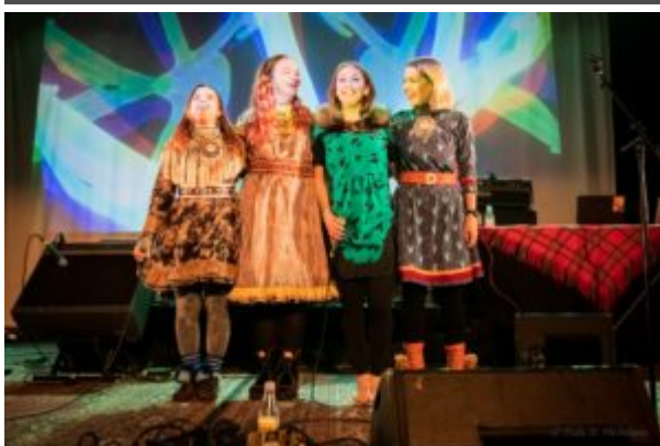
Concert of "Images of the North"