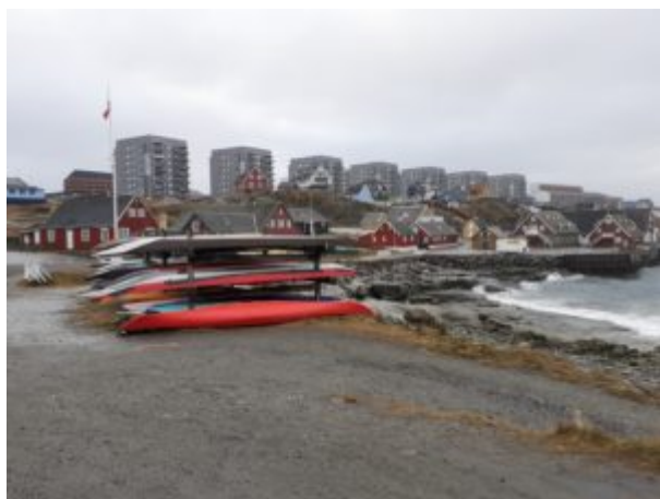
Qajaq at the colonial harbour

Nittartagarput takuuk: Saammaateqatigiinnissamut isumalioqatigiissitaq: namminersulivinnissamut siuarlaatissaq?