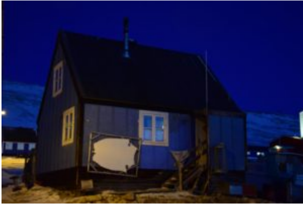
House with a drying sealskin