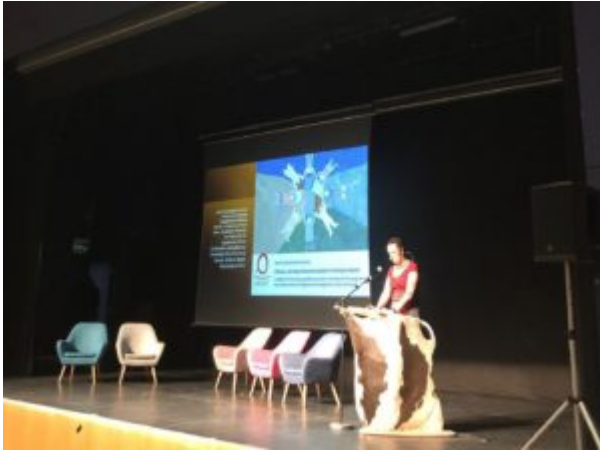
Rachael presenting at the Greenland Science Week